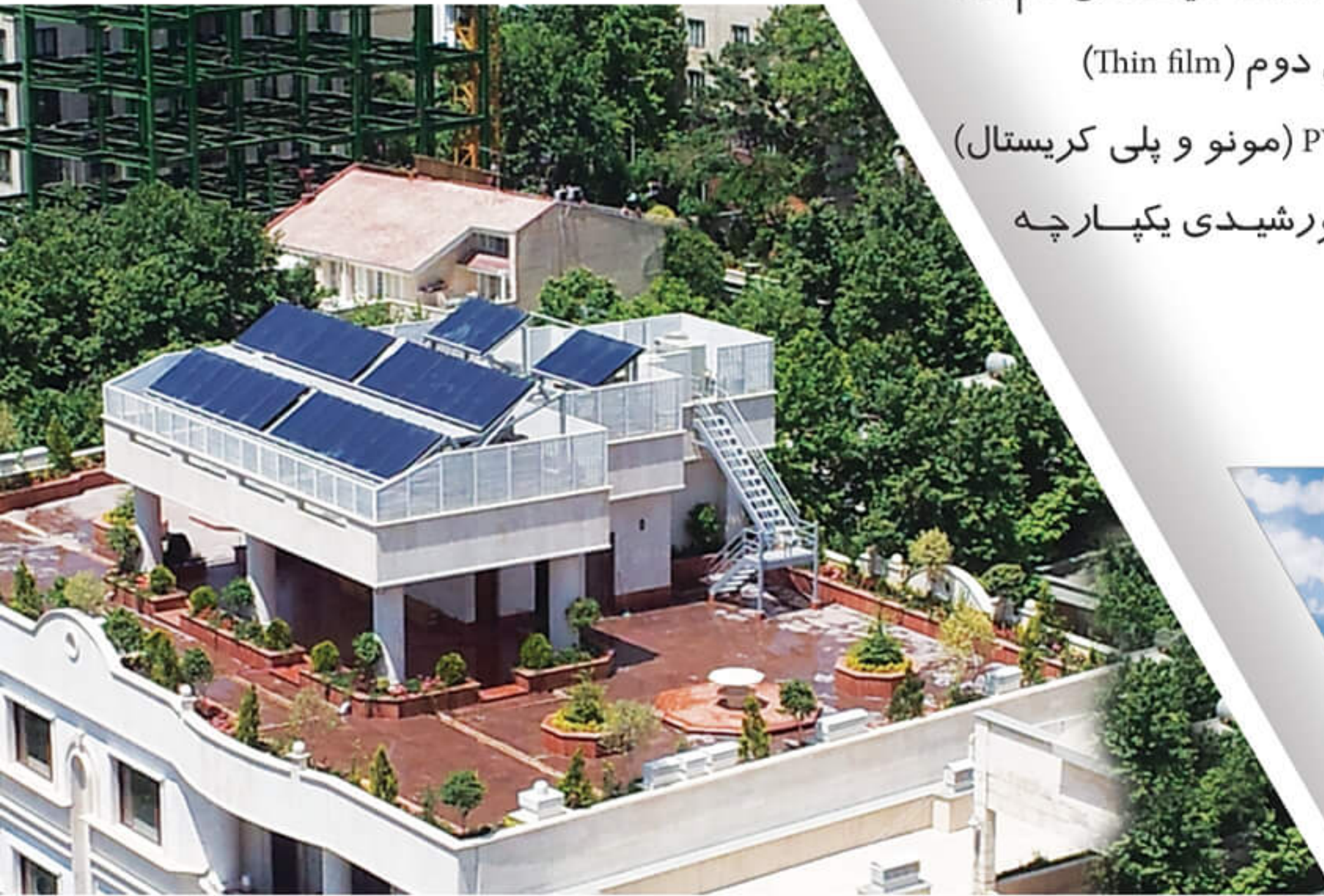
نمایی از پروژه اجرا شده