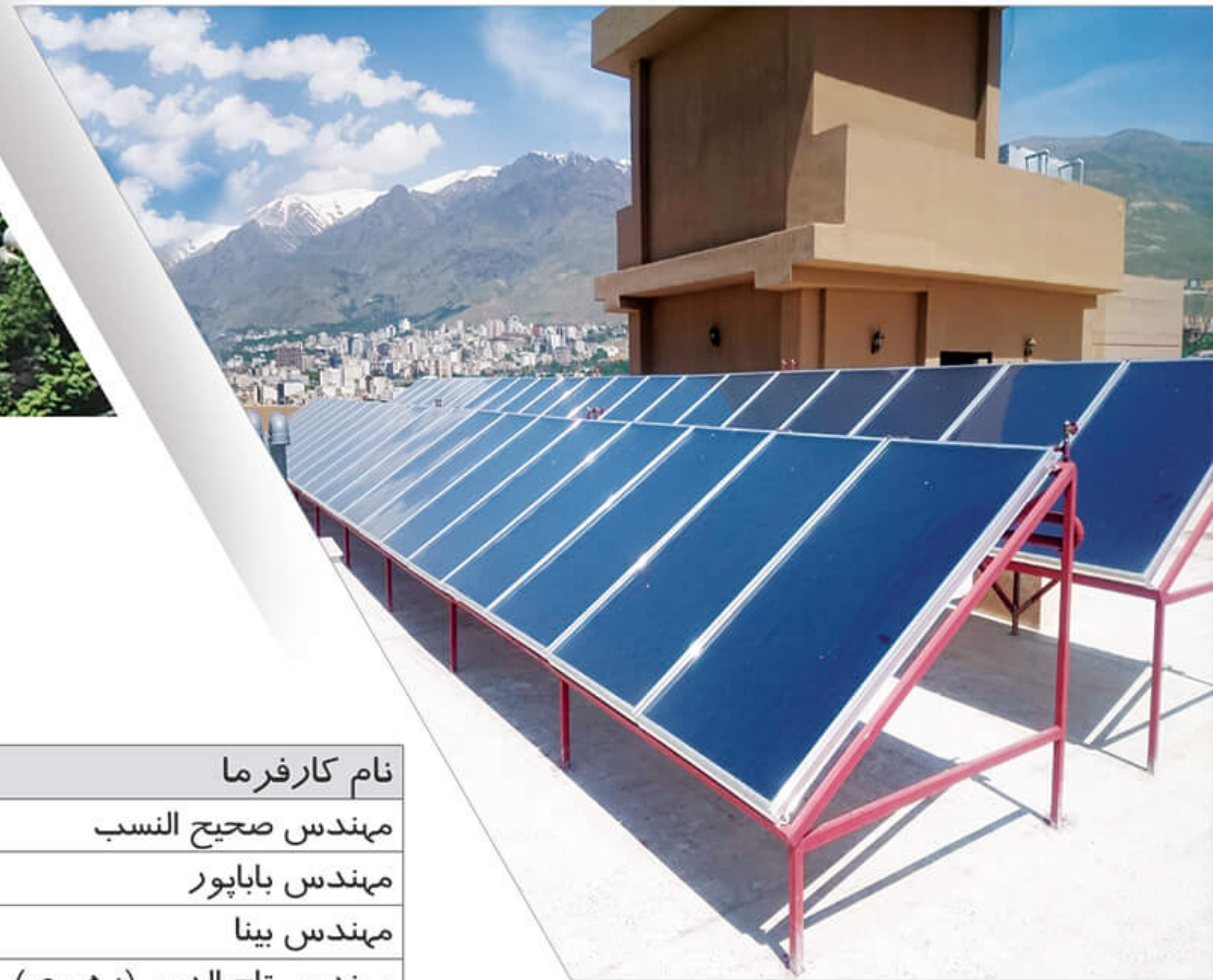
نمایی از پروژه اجرا شده